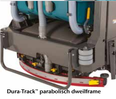
Dura-Track™ parabolisch dweilframe

Beschermkap beschermt gebruikers tegen vallende voorwerpen.