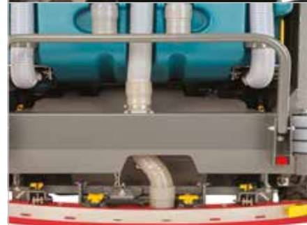
Gele aanraakpunten voor onderhoud

▶ Gele, gemakkelijk te herkennen aanraakpunten voor onderhoud besparen tijd en geld op routineonderhoud.