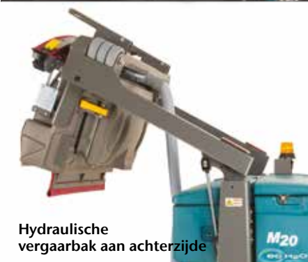
Hydraulische vergaarbak aan achterzijde

▶ Dura-Track™ parabolisch dweilframe met SmartRelease™ levert uitzonderlijke wateropname en vermindert onderhoud en vervanging van onderdelen wegens schade aan het dweilframe.