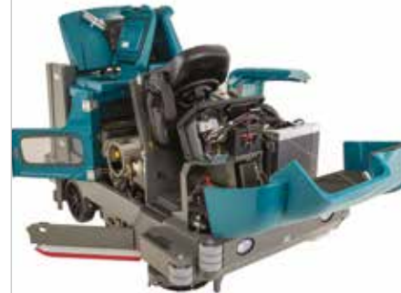
Ontwerp met gemakkelijke toegang

▶ Grote hydraulische vuilvergaarbak aan achterzijde met verschillende niveaus (110 L | 177 kg) verhoogt de reinigingsproductiviteit door het elimineren van de noodzaak om vuil handmatig te verwerken.