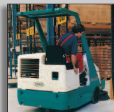
Machine in actie