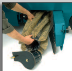
Zonder gereedschap vervanging van borstels