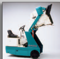
Op variabele hoogte te leggen vuilvergaarbak