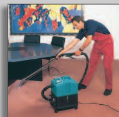
Machine in actie