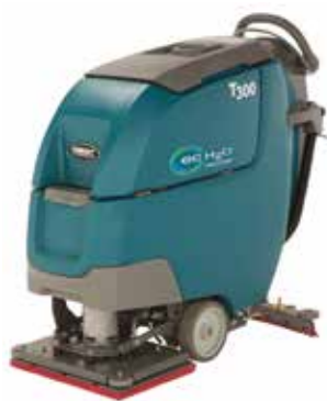
Orbitaal: 500 mm